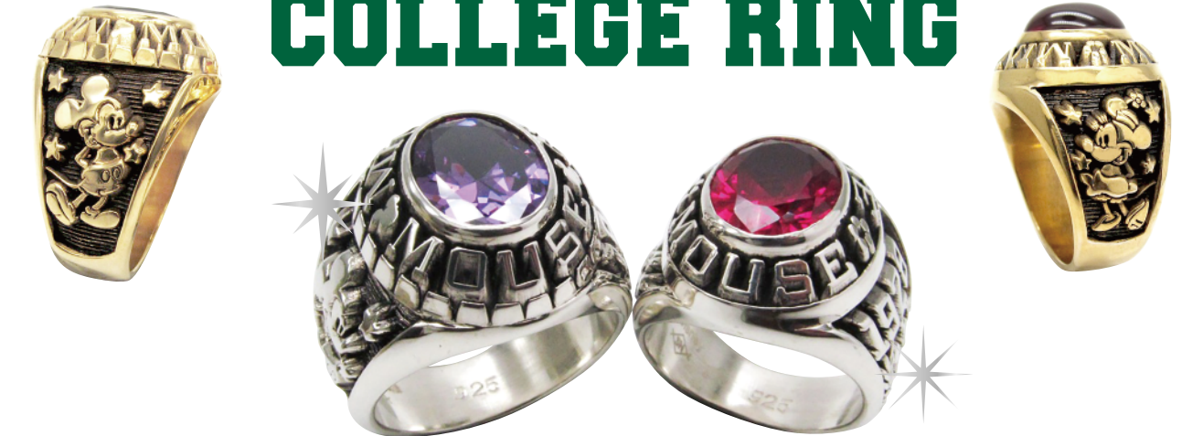
Standard Silver Edition