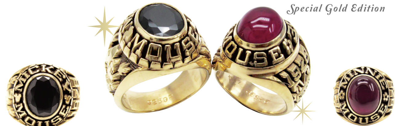
Special Gold Edition